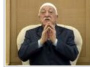
GÜLEN'DEN MAHMUT EFENDİ'YE TAZİYE