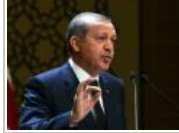
BÜROKRASİDE DEVİRİM GİBİ DEĞİŞİKLİK