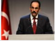
CUMHURBAŞKANLIĞI SÖZCÜSÜ KALIN'DAN SARKISYAN'A CEVAP

ANASAYFA GÜNCEL SPOR MAGAZİN FOTO GALERİ VİDEO YEREL DİĞER MOBİL