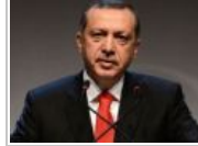
PARALEL YAPIDAKİ SAMİMİ İNSANLAR...