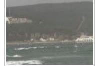
ÇANAKKALE'DE FERİBOT SEFERLERİ DURDU

Haberler » Son Dakika » Güncel » İstanbul